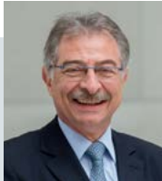
Prof. Dieter Kempf Stellvertretender Vorsitzender

Präsident Bundesverband der Deutschen Industrie e. V.