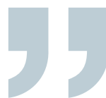
Prof. Dr.-Ing. Siegfried Russwurm

Präsident Bundesverband der Deutschen Industrie e. V.