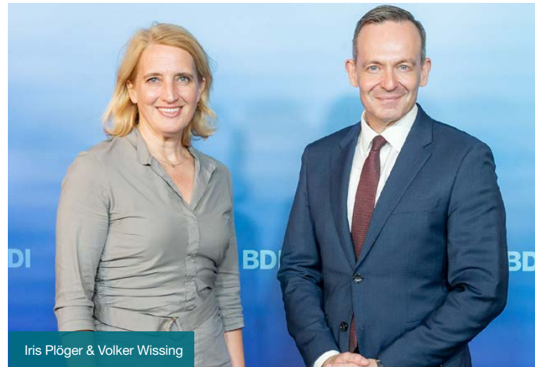
Iris Plöger & Volker Wissing