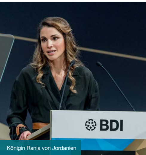
Königin Rania von Jordanien