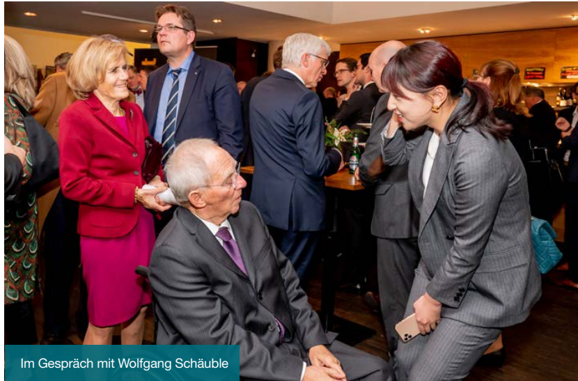
Im Gespräch mit Wolfgang Schäuble