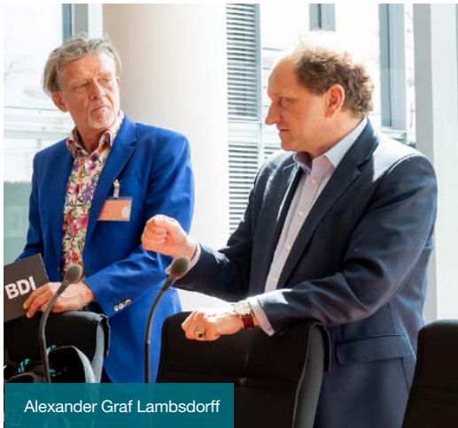
Alexander Graf Lambsdorff