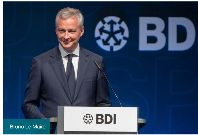
Bruno Le Maire