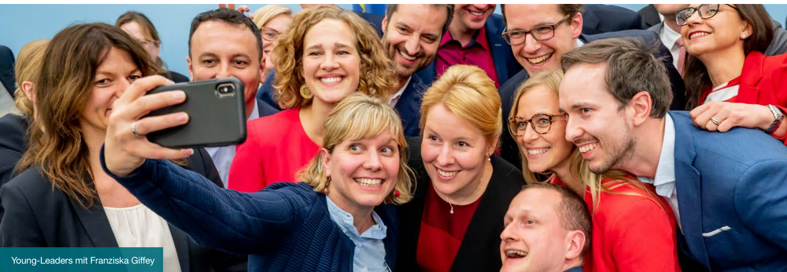
Young-Leaders mit Franziska Giffey