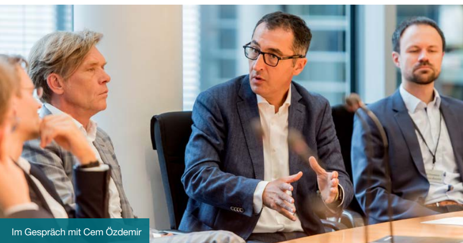
Im Gespräch mit Cem Özdemir