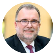
Prof. Dr.-Ing. Siegfried Russwurm Stellvertretender Vorsitzender

Vorsitzender des Vorstands Salzgitter AG